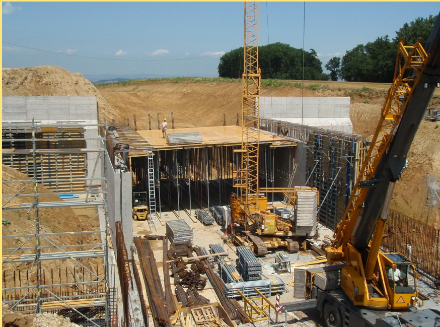
(Abb.: Arbeiten im Bereich der Grünbrücke I (Friedl))

Die elektrotechnischen Arbeiten für die Grünbrücken Metz und Födermayr sind bereits ausgeschrieben und werden noch heuer vergeben.