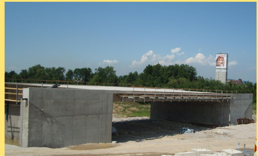
(Abb.: Unterführung Anschluss Volkersdorf)