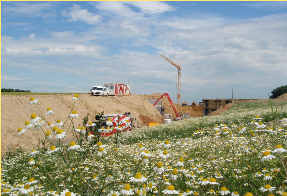
(Abb.: Bauarbeiten im Bereich der Grünbrücke I (Friedl))