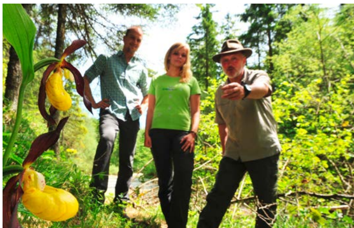
Eine Tour mit einem Nationalpark-Ranger.

180 Naturvermittler/innen begleiten die Abenteurer/innen – die kleinen ebenso wie die in Gruppen organisierten großen und die spontanen.