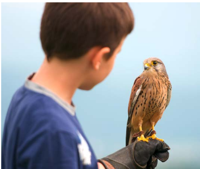
Der Turmfalke ist der Öffentlichkeit relativ vertraut, da er sich auch Städte als Lebensraum erobert hat.