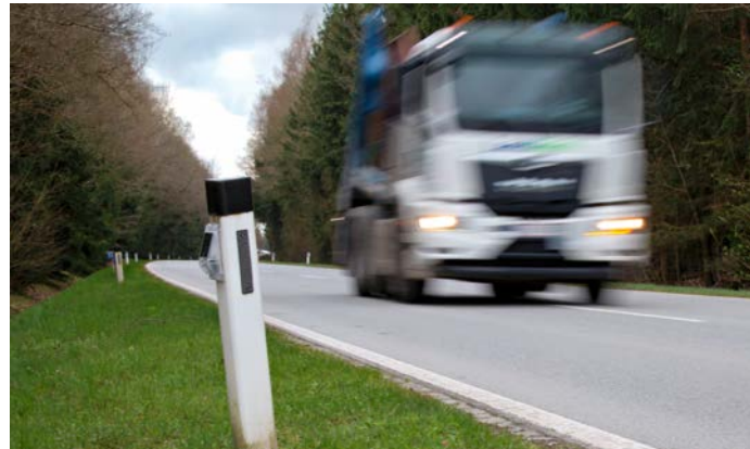
In den vergangenen Jahren wurden 600 Kilometer Straßenabschnitte mit insgesamt 37.000 Stück Wildwarnreflektoren ausgestattet.