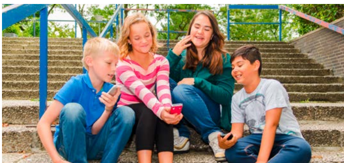
15.000 Acht- bis Elfjährige nutzen bereits die Juniorvariante.

Der Relaunch der App wurde auch genutzt, um die Bezahlung des Jugend-Taxis einfacher zu machen und weiterzuentwickeln.