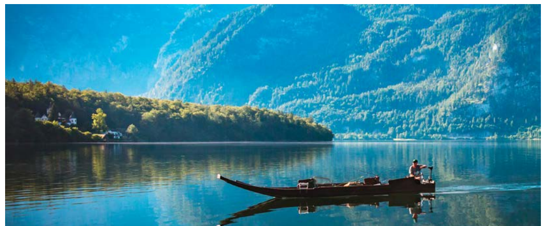
Ein Fischer auf dem Hallstätter See.

• Die Unterstützungen reichen von Projekten und Maßnahmen zur Verbesserung