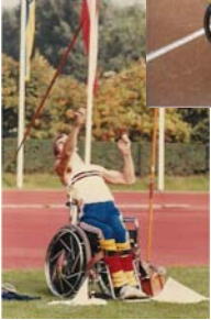
Training in Gruppe am Sportplatz