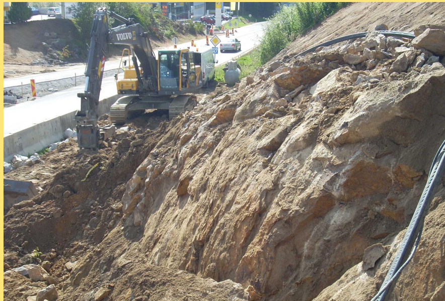
(Abb.: Felsabtrag im Baustellenbereich)