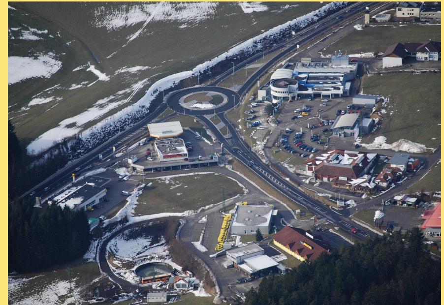
(Abb.: Flugaufnahme Jänner 2011)

Im Kreuzungsbereich der B38 bei km 153,22 und der B127 bei km 46,70 wurde ein 3-armiger Kreisverkehr mit einem Außendurchmesser von 50 m errichtet.