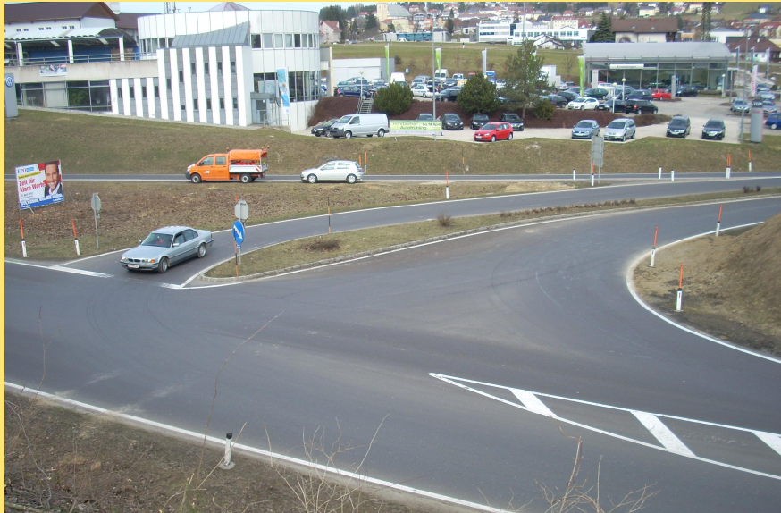
(Abb.: Bestandsaufnahme Kreuzung B38/B127)

Die Kreuzung der B38 Böhmerwald Straße mit der B127 Rohrbacher Straße, die sogenannte "Shell-Kreuzung" in Rohrbach war auf Grund des hohen Verkehrsaufkommens in den Verkehrsspitzen (in den Morgenstunden auf der B38 von Haslach Richtung Linz) überlastet bzw. bestanden sehr lange Wartezeiten beim Einbiegen.